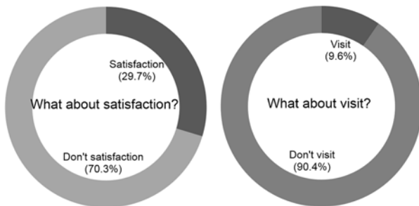
Fig. 2. Census data of apple growers and seller on the recommend pesticide satisfaction and seller visit service.

로 농약을 살포하는 경향을 보였다. 병해충의 발생양상이 단순하여 전체적인 살포횟수가 적은 곳감용 감의 경우 48.7%가 자의적 판단에 의해 농약을 선택하는 것(Lim 등 2008)과 비교하면 상당히 높은 농약판매상에 의존성을 나타내는 것으로 조사되었다.