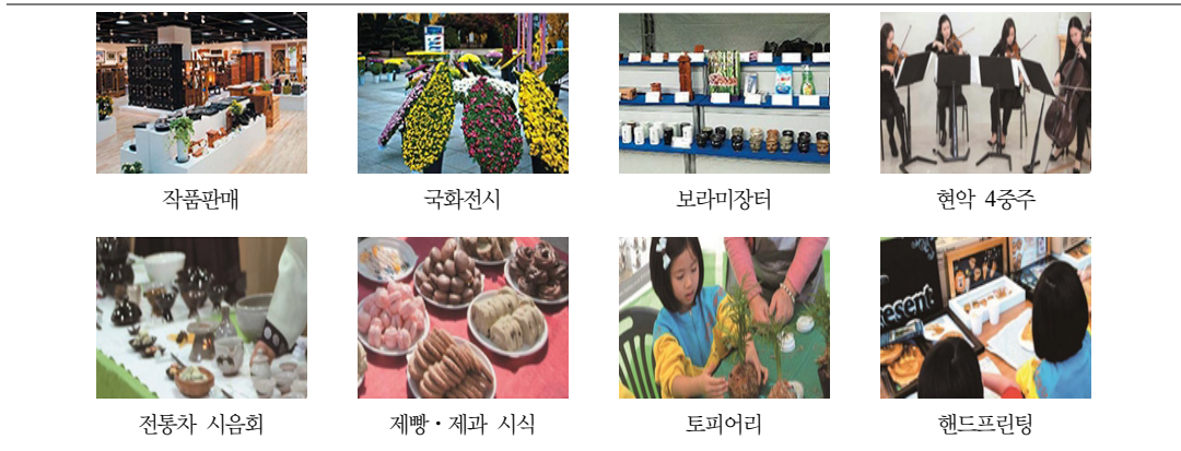
출처 : 제43회 '교정작품전시회' 홍보 팸플릿