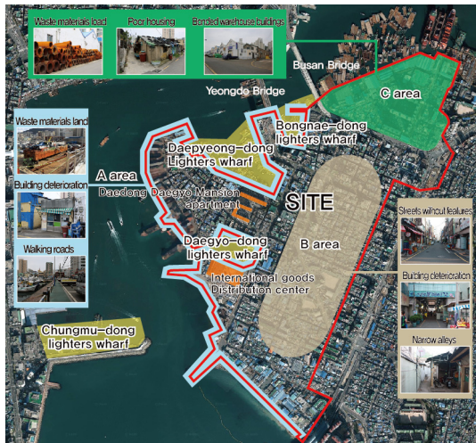
Fig. 1. Status map

대상지는 영도로 진입하는 관문지역의 성격을 가지고 있는 남향동, 봉래동 일대에(구역면적은 약 1,02km)에 위치하고 있으며 현재 3개의 물양장이 운영되고 있다. 일제강점기에는 석탄공장과 대규모아파트 단지가 밀집하였으며, 해방이후 해양권역개발계획을 통해 조선업, 물류업, 수산업을 중심으로 발전하였다. 현재 조선소와 도크, 창고 등 근대역사자원과 숙박업소, 근린생활시설, 선박관련 업체들이 혼재하고 있다.