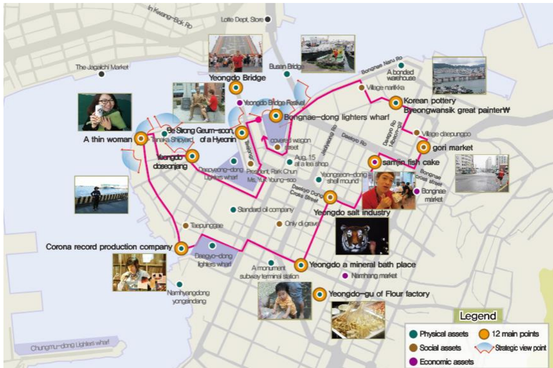
Fig. 3. Design diagram linked to regional assets

첫째, 물리적 재생은 (영도다리, ‘군세어라 금순아의’ 현인, 봉래동 몰양장, 영도 도선장, 영도의 밀가루공장, 코로나레코드 제작회사, 영도광천육장, 대한도기) 폐공간 및 가로에 얽힌 스토리를 상품화 하여 풍부한 문화 체험공간을 조성하고자 한다. 둘째, 사회적 재생은(강강이 아지매, 고리장터, 영도의 제염업) 스토리 발굴을 통