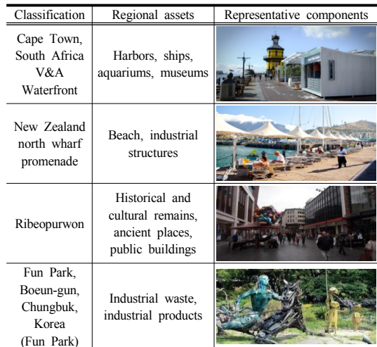
Table 3. Cases utilizing regional assets

국내·외 지역자산을 활용한 사례를 종합하면 첫째, 전반적으로 특정 유형의 자산이 중점 활용되는 방식이 아니라 몇 가지 유형의 자산이 한꺼번에 분포, 활용되고 있다. 둘째, 확인된 지역자산들은 핵심적인 자산과 이를 연계 및 뒷받침하는 보조적인 자산으로 구분되어 융복합화 방안이 종합적으로 고려될 수 있도록 전체적인 틀 (framework)이 우선적으로 고려되어야 한다. 셋째, 자연유형별 분포실태 분석에서 사회적 자산가운데 인적 자산이 모든 사례에서 공동으로 활용된 자산임을 알 수 있었다.