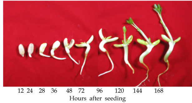
Fig. 1. A view of peanut sprout at 27°C in different germination stages.

유도함으로써 생체중과 건물중이 증가된 것으로 해석된다. 뿌리 성장도 발아에 이은 유도성장 단계를 거치면서 증가하였고, 발아 후 4일째에는 뿌리신장이 3.4cm 였으나 그 후 지속적으로 증가하여 발아 후 14일째에는