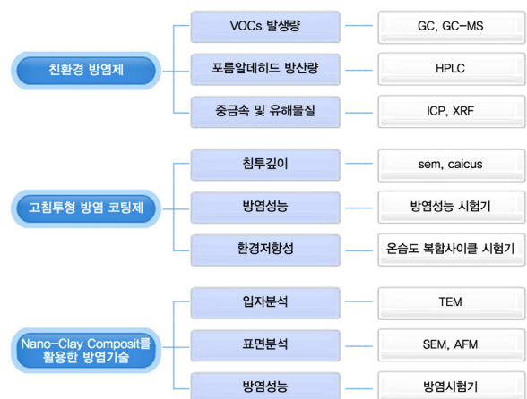
〈Fig. 2〉 Assessment items and analysis machinery according to the technology development with flame-retardant treatment

국내 규격인 KS F 2271 Chapter 3 항에 가스유해성평가 방법이 있는데, 시험용 흰쥐를 노출시켜 그 행동을 규정된 시간동안 지속적으로 측정, 쥐가 행동을 정지할 때까지의 시간(행동 정지 시간)에 의해 가스 유해성을 정성적으로 판단하는 시험법으로서, 방염제 및 방염제품의 성분에 의한 원인규명을 위한 정량 분석에는 한계가 있어, 발생가스를 정량적으로 평가할 수 있는 시험법도 방염성능의 가스유해성평가방법에 고려해야 한다.