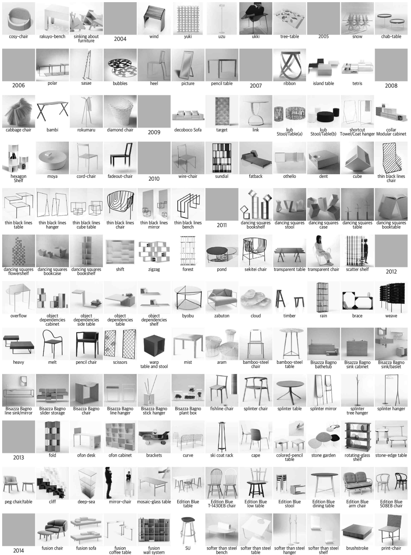
<그림 1> 2003년에서 20014년 상반기까지 발표된 네도의 가구