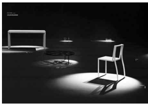
<그림 2> 동경 국제가구 페어, JCD 디자인상 은상, 2006

특히 넨도의 가구전시는 자신들의 가구를 위한 색다른 전시공간 연출을 통해 자신들의 전시가 단순히 가구를 보여 주는 전시가 아닌, 디자인의 특정분야의 틀을 깨는 행위임을 보여 주고 있다. 이러한 그들의 가구전시는 세간의 이목을 끄는 독특한 가구전시로 높게 평가 받으며, 가구 전시 그 자체가 디자인상의 대상이 되기도 하였다. <그림 2, 3>