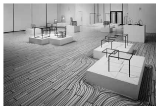
<그림 3> thin black lines + dancing squares, Taiwan, 2011