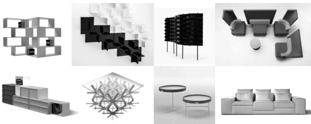
<그림 9> 쉽게 조합하여 사용할 수 있는 넨도의 가구들

그러나 넨도의 조합형 가구는 기존의 조합형 가구에 비하여 복잡한 조립부품을 사용하지 않는 아주 단순한 조합개념으로 디자인되어 누구나 쉽고 직관적으로 가구를 조합하여 다양한 형태를 만들어 사용할 수 있는 것이 특징이다.