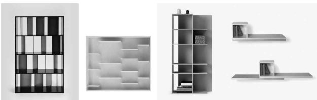
<그림 10> 부분적 요소를 재배치한 넨도의 가구들

아주 단순한 방법이지만 디자인의 결과물에서 보여 지는 형태의 색다름은 넨도 디자인의 특성의 하나가 되고 있다.