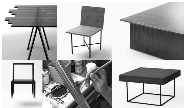
<그림 14> 물성의 반전에 의한 착시 가구들

목재의 결이 섬세하게 표현된 성형 아크릴판으로 마치 목재가 투명성을 가진 것처럼 만들거나, 목재의 결을 프린트한 필름을 한 장 또는 여러 장을 붙여, 실제 목재에서는 만들어 낼 수 없는 새로운 나뭇결을 만들어 내기도 한다. 그리고 섬세한 수작업의 붓칠을 통해 아크릴이나 유리에 나뭇결이나 대리석의 문양을 그려 넣어 소재가 다른 소재로 착각을 일으키는 물성의 반전으로 전혀 새로운 감각을 가진 가구를 만들어 내기도 한다. 종이와 콘크리트를 혼합하여 경량화 된 콘크리트를 만들어 내어 시각적으로는 엄청난 무게감이 느껴지지만 실제로는 아주 가벼운 가구로, 가구 소재로서의 콘크리트의 가능성도 보여주기도 한다.<그림 14>