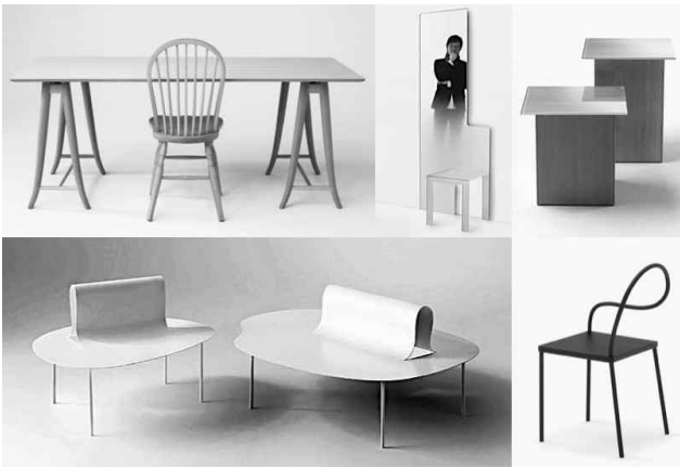
<그림 16> 넨도가 디자인한 목재, 유리, 금속 가구로 전문화된 국제적 브랜드 Otsuka Furniture, Glasitalia, Desalto의 가구들

특히, 이러한 넨도의 명성은 목재, 유리, 금속 등 재료적인 전문성을 갖춘 국제적인 가구브랜드들의 가구를 통해서 더 명확하게 확인할 수 있다.<그림 16>