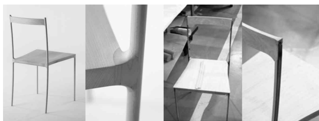
<그림 15> cord-chair, 2009

이러한 넨도 가구의 특성은 사토 오오키가 귀국 후 일본 공예에서 받은 감명이 반영된 것으로 다양한 재료에 뛰어난 장인들의 수작업이 접목되어 쉽게 모방할 수 없는 그들만의 가구를 만들어 낸 것이라 할 수 있다.