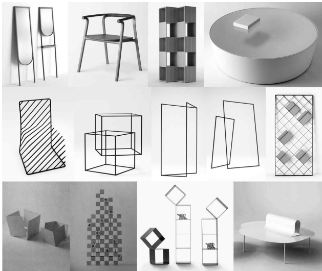
<그림 12> 조형적 착시 가구들

이러한 가구들은 일견 누구나 떠올릴 수 있는 평범한 아이디어로 만들어진 가구로 보여 질 수 있으나, 넨도 내부의 시각분야 디자이너들과의 협업과 가구장인들의 뛰어난 제작기술로 만들어진 가구들로, 이러한 가구들의 섬세함은 일상성을 탈피하고 있다.