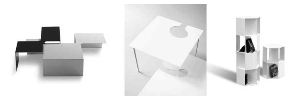
<그림 6> 형태의 변형: 자르기