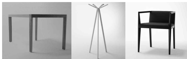
<그림 7> 형태의 변형: 깎기

그러나 넨도는 이러한 여러 가지의 형태 변형의 방법을 복합적으로 사용하지 않으므로써, 단순 명료하면서도 그들의 디자인을 부각하는 알기 쉬운 형태를 제시 하고 있다.