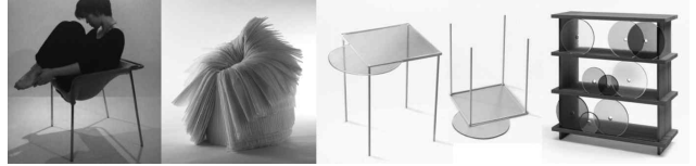
<그림 11> 재료의 물성적 특성을 살린 넨도의 가구들

려 활용한 것뿐만 아니라, 재료에 대한 실험을 통해 새로운 재료를 만들어 내거나 수공예적인 가공 기법을 통해 기존의 재료와는 차별화된 새로운 형태를 만들어 내기도 한다. 이는 넨도의 아이디어뿐만 아니라 이를 뒷받침하는 장인정신이 투철한 수공예기술자와 가구장인들이 함께 만들어낸 성과이기도 하다.