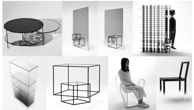
<그림 13> 물성에 의한 착시 가구들

기능성과 상관없이 시각적 즐거움을 주어, 일상성을 탈피하는 유틸리티 있는 오브제가 되기도 한다.