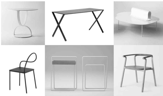
<그림 5> 형태의 변형: 구부리기

넨도 가구의 2/3는 형태의 변형을 통해 만들어진다. 이들 가구는 육면체, 원통형 등 기하학적인 기본 형태에 새로운 발상을 부가하여 기존 가구와는 차별화된 새로운 형태를 제시하고 있다. 이러한 형태의 변형은 세부적으로 판재나 선재를 구부리거나 잘라낸 것 같은 단순한 형태변형 방법이 가장 많이 사용되며<그림 5, 6>, 가구의 구성요소의 부피를 깎아 내거나<그림 7> 가구의 부분적인 요소를 없애는 등의 방법도 사용한다.