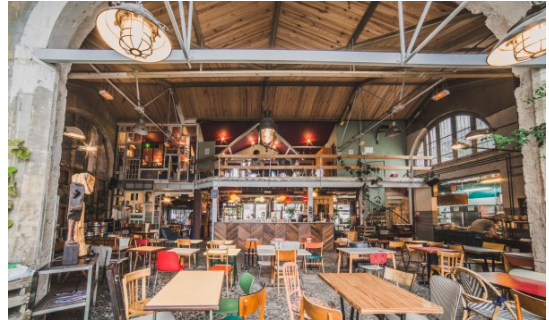
Fig. 1. Inside of La Recyclerie

물품을 가져와서 수리를 맡기거나 직접 수리할 수 있는 장비들을 지원하고 있다.[6]