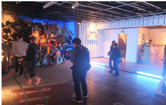
Fig. 3. Exhibition in Le Hasard Ludique before Official Opening

진되었다. 1층은 250석 규모의 공연장(90m 2 )과 함께 주방을 갖춘 식당 공간(100m 2 )으로 구성되며, 2층은 독립 공간과 가변적 공간을 갖춘 창작활동을 위한 아틀리에(40m 2 )로 활용될 계획이다.[7,8]