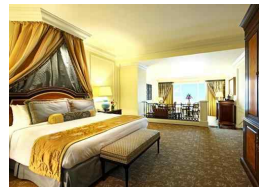
<그림 4> The Venetian Macao, Macao, 2007

도시특색 호텔은 보통 문화적 특징이 강한 도시를 주제로 디자인하거나, 도시 토대로 부분 지역에 대한 시뮬레이션과 축소 재생의 방식으로 도시의 풍모를 재현한 호텔이다. 마카오의 <그림 4> The Venetian Macao호텔도 이 부류에 속한다. 이 호텔은 저명한 수상 도시인 베니치아의 문화적 스타일로 장식을 하였다. 9) 객실의 설계는 많은 베니치아 문화 요소들의 사용으로 지중해의 풍토와 베니치아 수상 도시의 문화를 충분히 표현하였다.