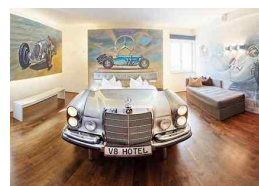
<그림 8> V8 Hotel, Germany, 2009

디자이너의 세계관이 담긴 디자인 요소가 공간에 표현되면서 공간을 체험하는 고객과 소통하는 내러티브 표현의 역할을 한다. 호텔은 상징적인 의미를 가진 하나의 ‘랜드 마크’로서의 공간을 제공한다. 13) 이는 디자이너의 독창적인 개성이