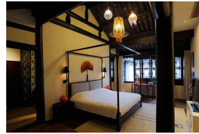
<그림 2> Blossom Hill Inn Zhouzhuang Seasonland, China, 2012

대하여 한층 깊이 이해할 수 있도록 한다. 8) 그 외 도자기를 직접 만들 수 있어 도자기 예술의 특별한 매력을 느낄 수도 있다.