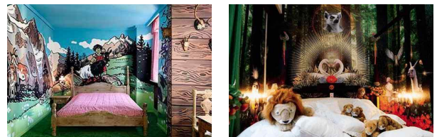
<그림 5> Hotel Fox, Denmark, 2005

예술특색 호텔의 디자인은 다양하고 객실마다 다른 컨셉으로 표현된다. 예술 영역에 속하는 음악, 영화, 미술 등은 모두 예술 테마호텔이라고 할 수 있다. 10) 덴마크의 코펜하겐에 위치한 <그림 5>의 Hotel Fox의 모든 객실은 모두 국제 최고의 비주얼 디자이너들이 설계한 것이다. 21명의 디자이너가 Hotel Fox에게 1,000개의 아이디어를 제공하였으며 최종 61개의 객실을 만들어 내었다. 11)