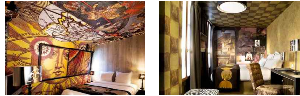
<그림 6> Bellechasse Hotel, Paris, 2007

는 상태를 나타내게 된다. 12) 프랑스에 위치한 <그림 6>의 Hotel Bellechasse은 신고전주의의 고급스러운 느낌에 보헤미안의 자유로운 느낌과 현대적인 모던함을 조화롭게 혼합하여, 지금까지 보지 못한 새로운 공간 이미지를 만들어 내고 있다.