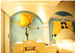
<그림 10> Hotel Panda Inn, China, 2013

다문화 디자인을 다루는 오늘날에 다양한 문화의 도입은 불가피한 현실이다. 특히 뚜렷한 지역적인 문화 특성을 가지고 있는 도시에서 테마호텔의 객실 디자인은 지역적인 요소를 더욱 고려하여야 한다. 지역 문화 속에서 주제를 추출하여 도시 이미지를 강화할 수 있다. 중국 사천성에 위치한 <그림 10>의 Hotel Panda Inn은 전 세계 최초로 팬더를 주제로 한 호텔이다. 중국의 70%이상의 팬더가 중국 사천성에 있으며 사천성은 중국 팬더의 고향이기도 한다. Hotel Panda Inn의 객실 디자인에서 사천성의 팬더라는 지역적인 문화를 뚜렷하게 표현하였다.