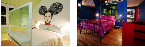
<그림 9> New Majestic Hotel, Singapore, 2006