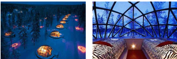
<그림 1> Hotel Kakslauttanen, Finland, 2012

자연경관호텔은 자연의 풍경을 전제로 하고 자연의 경치를 호텔의 건물과 결합하여 마치 자연 속에 들어있는 느낌을 주는 장경을 구현한 호텔이다. 7) 이는 호텔과 생태환경의 완벽한 결합이라고 할 수 있다. 핀란드의 Urho Kekkonen 국립공원 근처에 포근하게 녹아있는 호텔 Hotel Kakslauttanen은 자연과 잘 결합한 호텔이다. 이 호텔은 북극을 제대로 체험할 수 있게 통나무로 만든 핀란드 전통가옥과, 눈으로 만든 이글루 그리고 유리로 구성되어 있다.