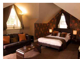
<그림 7> The Chocolate Boutique Hotel, England, 2013

영국에 위치한 <그림 7>의 The Chocolate Boutique Hotel은 전 세계 최초로 초콜릿을 주제로 한 호텔이다. 객실 안에서 초콜릿 분수를 장식하여 바로 먹을 수 있는 체험이 있다. 객실에서 체험 디자인을 통하여 고객의 소통을 연결하며, 객실 디자인은 최종적으로 고객에게 특별한 체험을 가져다 줌으로 고가의 이윤을 창출하는 것과 관련이 있다.