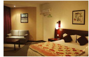
<그림 3> Starway Qinghua Thematic Hotel, China, 2008