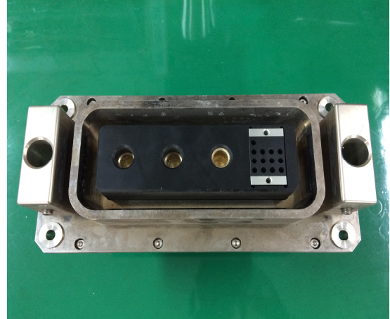
Fig. 1. Coupler for EV Bus with Battery Swapping-system

이용하여 내구시험을 진행하였다. 그림 1은 실제의 배터리 교환형 전기버스용 접속기이며, 제원은 표 2와 같다.