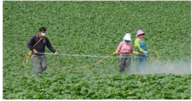
Fig. 1. The pesticide spraying work.

본 연구는 상대적으로 농약을 많이 살포하는 고랭지 배추 농작업자를 대상으로 하여 피레스로이드계 살충제의 노출에