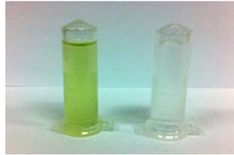
Fig. 1. HLB clean-up samples of agricultural water for PFCs analysis after Envi-Carb TM treatment (right) and untreated (left).

Envi-Carb TM (Supelco Co., PA, USA)은 탄소계 흡착제로 식품 시료 중 과불화합물 분석시 cholic acid등과 같은 정량 간섭물질을 제거할 목적으로 시료정제 마지막 단계에서 사용되고 있다 (Ballesteros-Gomez et al., 2010). 본 시험에서는 고시 시험법에 따른 HLB 시료 정제 후 Envi-Carb TM 처리단계를 보완하여, 색소 등 미지의 간섭물질 제거여부와