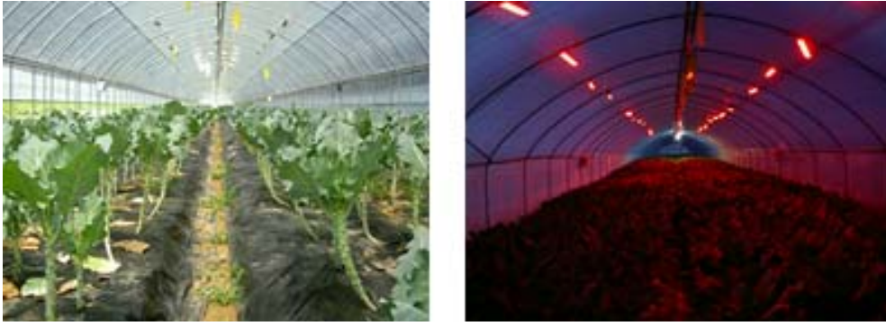
Fig. 1. Inside view of the kale greenhouse before (left) and after (right) supplementary radiation provided by three wave lamps, sodium lamps, and red LEDs.

해 태양광 입사량이 부족해지거나 계절적으로 일장이 짧아지는 시기에는 작물의 광합성과 생장을 촉진시키기 위해서는 인공광을 이용하여 온실내 부족한 광을 인위적으로 보충해주는 보광기술이 필요하다(Albright, 1997; Dorais, 2003; Heo et al. , 2010; 2011a; 2011b). 온실재배 작물의 영양생장 및 생식생장에 영향을 미치는 다양한 환경요인 중에서 광강도와 광질은 보광을 위해 사용하는 인공광원의 영향을 받게 되는데, 온실과 같은 시설에서는 주로 고압나트륨등, 삼파장등, 백열등이나 메탈할라이드등과 같은 광원을 이용하여 보광하고 있다(Farina and Veruggio, 1996). 이 중에서 삼파장등, 백열등 및 고압나트륨등과 같이 비교적 전기에너지 소모량이 많은 인공광원은 우리나라 시설재배지에서 자연일장 연장을 위한 보광 목적보다는 동절기에 광원으로 부터의 발열로 인한 시설내부 온도상승을 목적으로 많이 사용한다. 그러나, 일부 작물재배를 제외하고는 전력소모량에 비해 온도상승이나 보광에 의한 생장촉진 효과는 현저하지 않은 것으로 알려져 있다.