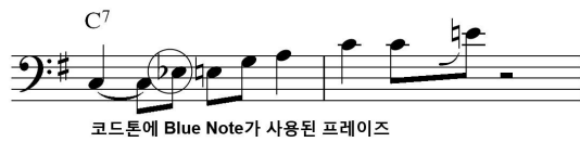
[Fig. 9] 5 th measure to 6 th of 1 st Solo Chorus Of Solo With Bow Part

5-6 번째 마디[Fig. 9]의 프레이즈를 보면 C7코드의 코드 톤에 Blue Note인 Eb음을 추가시켜 블루지한 느낌을 준다.