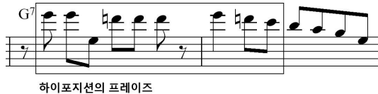
[Fig. 10] 7 th measure to 8 th of 1 st Solo Chorus Of Solo With Bow Part

7-8번째 마디[Fig. 10]에선 G Mixolydian 스케일을 하이포지션에서 연주했다.