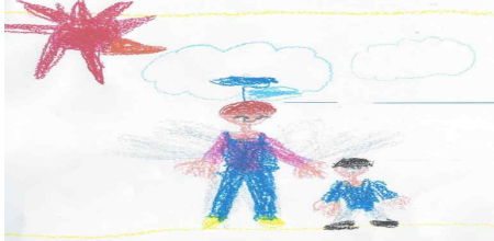
[그림 1] 선생님과 이야기하는 모습을 표현한 남성보육교사 유아의 그림