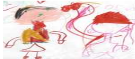
[그림 2] 선생님과 책과 관련된 활동을 표현한 여성보육교사 유아의 그림