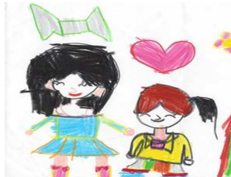
[그림 6] 선생님과 함께 언어적 게임을 하는 여성보육교사 유아의 그림