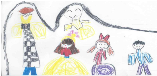
[그림 3] 선생님이 친구들에게 잘 해주는 것을 표현한 남성보육교사 유아의 그림