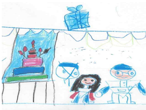
[그림 7] 선생님과 함께 생일 축하를 위해 촛불 불기전의 모습을 표현한 남성보육교사 유아의 그림