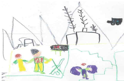
[그림 5] 선생님과 함께 산에 가는 것을 표현한 남성보육교사 유아의 그림