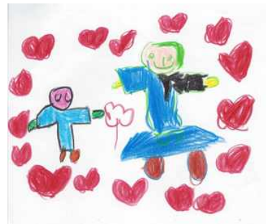
[그림 4] 선생님이 안전하게 손을 잡고 이동하는 것을 표현한 여성보육교사 유아의 그림