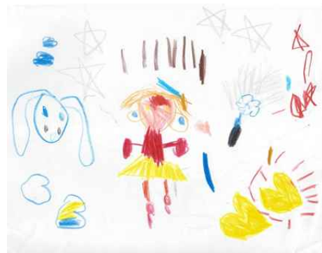
[그림 8] 교실을 청소하는 선생님의 모습을 표현한 여성보육교사 유아의 그림