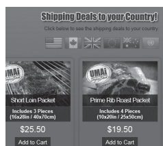
국제적으로 인터넷 직접구입이 가능한 종류별 건조숙 쇠고기판매