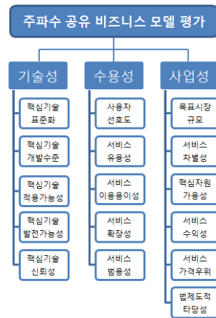
그림 1. AHP 계층도

본 연구에서 제안하는 비즈니스 모델 평가방법은 주파수 공유 기술 상용화에 따른 산업계 측면의 경제성 확보, 이용자 측면의 효용 증대, 정부 입장의 산업 활성화 목표의 달성 여부를 합리적으로 판가름하여야 한다. 3가지 목표를 평가속성으로 하고, 속성별 평가항목을 다시 세분화하면 유망 비즈니스 모델 선별에 대한 계층 분석절차를 설정할 수 있다. 여러 비즈니스 모델 대안 평가를 위한 평가속성과 하위 평가항목의 조작적 정의를 토대로 [그림 1]의 AHP 계층도를 제시한다.