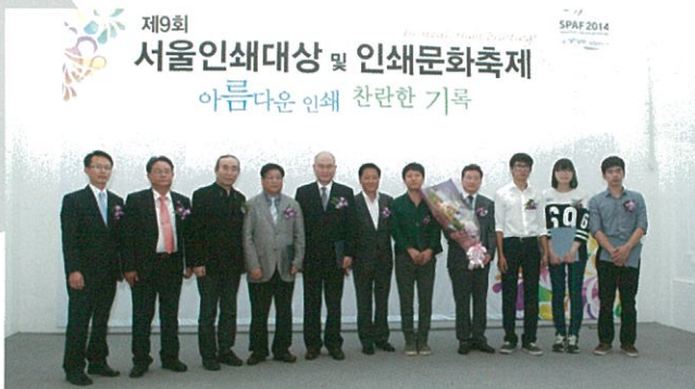
제9회 서울인쇄대상 수상자들