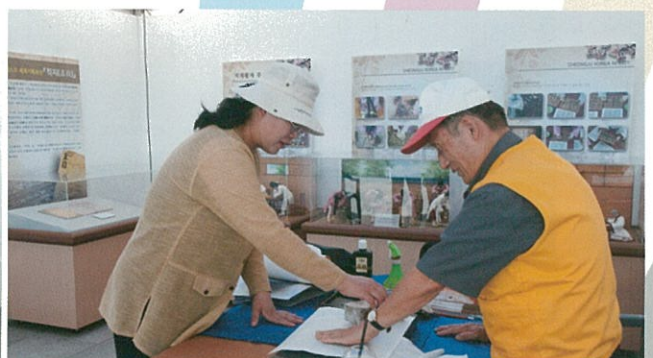
고인쇄문화 홍보관에서는 직지 등 우리나라 고인쇄의 역사성에 대해 홍보했다.