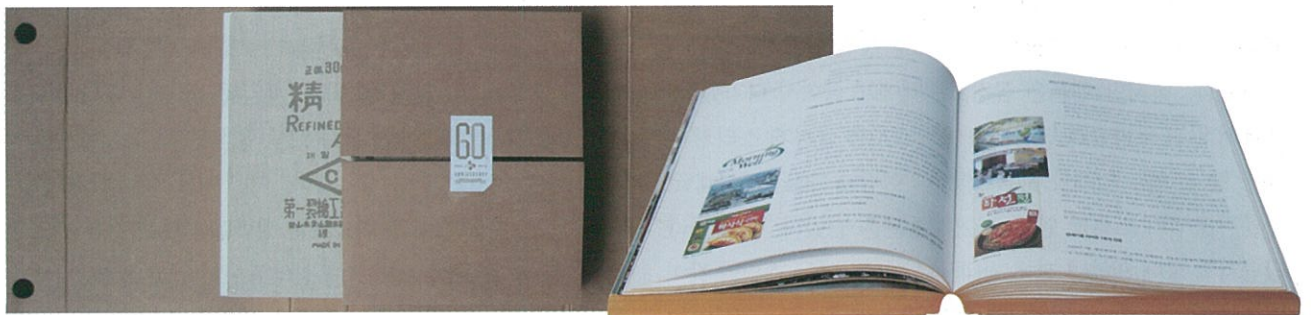
'제9회 서울인쇄대상 시상식'에서 대상을 수상한 'CJ 사사'

이광재 대표는 가장 기억에 남는 인쇄물로 2006년 제작한 하얏트호텔 룸서비스용 안내책자와 바인더커버를 꼽았다. 이광재 대표는 “하얏트호텔 룸서비스용 안내책자와 바인더커버는 아직도 기억에 남을 정도로 생생하다. 처음 작업을 수주했을 때에는 그리 어려운 작업이 아니었기에 늘상 하던대로 작업했다. 그런데 담당자가 정말 너무나 까다로웠다. 실밥이며 땀수까지 하나하나 확인하는 등 보이지 않는 부분까지 확인하며 수정을 요구했다. 수정작업은 약 20회 정도 진행됐다. 당시 수차례의 보완요구에 중도에 포기하고 싶었지만 이 일을 극복하지 못하면 어떤 일도 할 수 없다는 생각이 들어 포기하지 않았다. 20번에서 끝났지만 100번이라도 할 각오로 임했다”고 말했다. 이 일은 이광재 대표를 비롯한 금강프린텍 직원의 품질에 대한 인식을 송두리째 바꾸는 계기가 됐다. 이 대표는 “바인더 커버의 땀수까지 체크하는 등 보이지 않는 부분까지 확인하게 되면서 완벽한 일처리라든가 어떤 것인지 알게 됐다. 완벽한 인쇄작업을 한다면 영업도 필요없다는 것을 새삼 깨닫게 됐다”고 말했다.