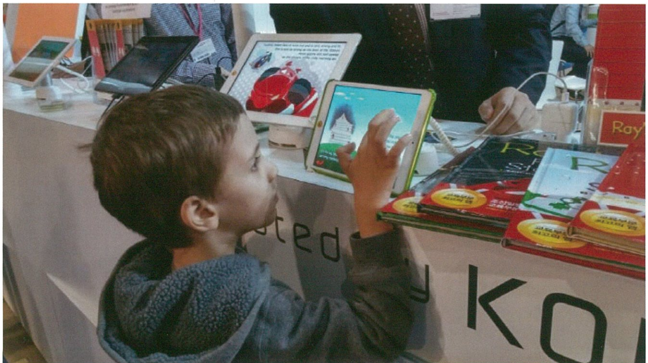
전자책 전시 및 체험 프로그램이 확대 운영된 2014년 프랑크푸르트 도서전

이처럼 전자책 시장의 꾸준한 성장세가 이어지면서 세계 최대 도서전 중 하나인 프랑크푸르트 도서전에서도 전자책과 디지털 1인 출판이 핵심 이슈 중 하나로 다루어졌다. 세계 102개국 7천여 출판사가 참여한 가운데 금년 10월 개최된 제66회 프랑크푸르트 도서전에서는 국내기업인 삼성이 협력기업으로 참여해 별도 스튜디오를 운영하면서 전자책과 연관된 다양한 디지털 콘텐츠를 선보였으며 비즈니스클럽 섹션 운영을 통해 전자책과 디지털 1인 출판 등 새로운 디지털 시대 맞춤형 사업의 활로를 모색하기도 하였다.