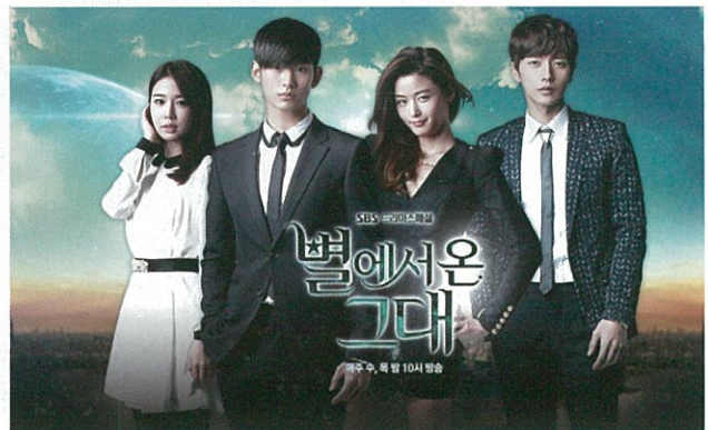
드라마로 만들어진 후 판매가 급증한 '별에서 온 그대'

중국 시장을 중심으로 국내 출판물의 해외 진출 기반이 강화된 반면 국내 출판시장 불황은 지속되었다. 2014년 국내 출판시장에서는 미디어(영화 및 드라마)와 광고를 통해 노출되어 유명해진 책이 독자들에게 집중적으로 선택되는 이른바 '미디어셀러' 현상이 강화되었다. 인터파크가 2014년 상반기 국내 베스트셀러 상위 100권을 분석한 결과 대부분이 미디어셀러에 속하거나 기존에 충성도 높은 독자들을 확보하고 있는 기성작가들의 서적인 것으로 드러났다. 예를 들어 <별에서 온 그대>의 경우 2009년 첫 출판 이후 별다른 반응을 얻지 못하다가 드라마로 만들어져 알려진 이후 판매량이 급증하였으며 소설 <미비포유>는 'TV 책을 보다'라는 방송 프로그램에 소개되면서 판매량이 급상승하였다. 또한 <창문 넘어 도망친 100세 노인>이나 <두근두근 내 인생> 등의 책도 드라마 및 영화가