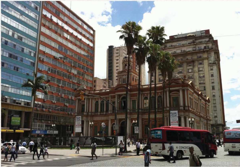
〈사진 2〉 포르투알레그리 시청 및 시청 앞 광장

남아메리카 전체 지도 속에서 볼 때 포르투알레그리는 브라질 남부에서 아르헨티나와 우루과이로 이어지는 남아메리카 대평원 팜파스(Pampas)지역의 북쪽에 위치하며, 남미 공동시장인 메르코수르(Mercosur)를 구성하는 브라질, 아르헨티나, 파라과이, 우루과이 4개국 인구 밀집 지역의 정중앙부에 위치하고 있다. 이러한 입지적 이점이 포르투알레