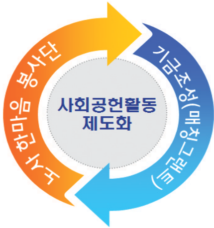
〈그림 3〉 사회공헌활동 제도화