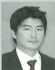
박정완 기자 축산경제신문

소비심리 위축·공급과잉 심화 ‘수급 불균형’ 육계 사육농가·계열업체 줄도산 우려 ‘비상’ 업계 “주저앉을 순 없다” 타개책 모색 나서