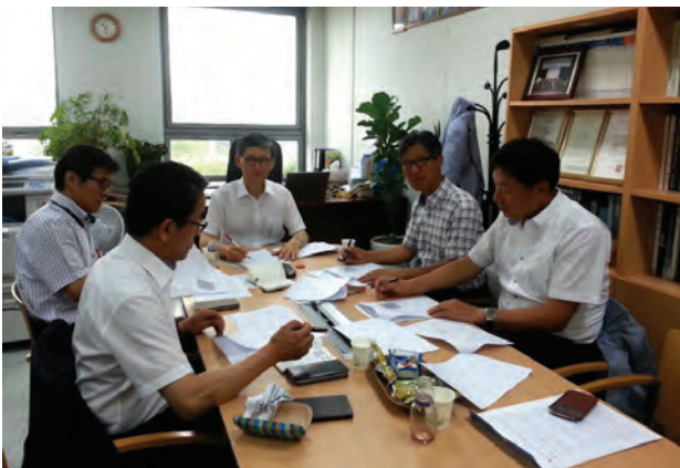
[구조기준모니터링(국토부 연구과제) 착수회의]