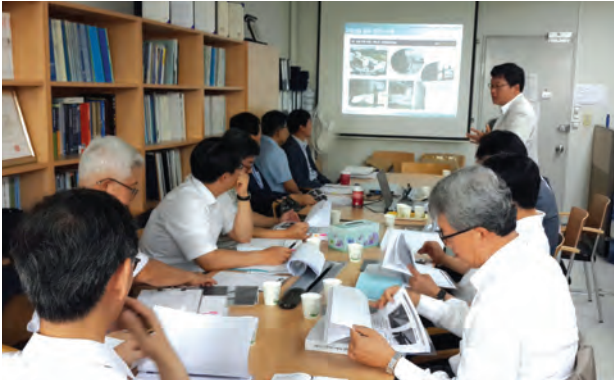
[제일테크노스 CAP DECK기술인증회의]