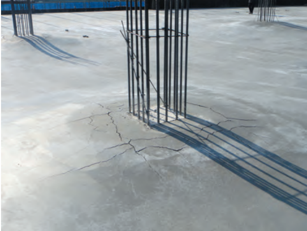
[그림 5] 5층의 콘크리트 양생전 처짐

날짜로는 3주의 양생이나, 양생기간동안 평균기온으로 영하의 날씨는 양생일에서 제외하고 0~5도일 경우에는 반일로 취할 경우 2주 양생도 채 못 미치는 정도였다.