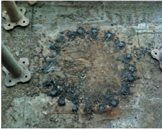
[그림 3] 산소 절단면

이것이 두 번째의 원인으로 작용한 것이며, 세 번째 원인은 그림3과 같이 도면을 잘못 판독하여 못 설치된 기둥을 제거하는 과정이다. 상부에 설치된 기둥철근을 콘크리트가 충분히 양생되지 않은 상태에서 타설 다음날 산소용접기를 사용하여 기둥철근을 절단하였다. 기둥 주근의 간격이 조밀하였고 용접절단기의 열 영향을 고려한다면 이미 구멍을 뚫어 놓은 양상이 발생된 것이다. 이와 같이 여러 가지 요인이 결합되어 하나의 사고를 낸 것이다. 앞에서 언급한 세 가지의 요인이 있는 상태에서 건물이 붕괴되는 것은 이미 예고가 된 것이나 다름이 없다.