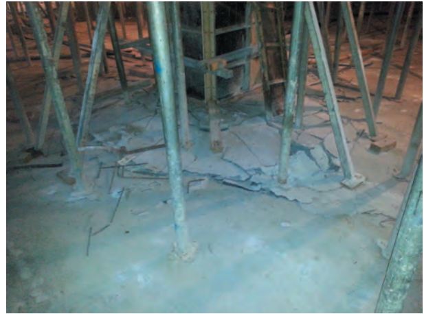
(a) 4층 상부의 뚫림전단 발생 모습

이방향중공슬래브 시스템에서 중공체가 매립되는 부분의 전단강도는 60%로 저감하기 때문에 전단력이 큰 기둥주변에는 경량체를 매립하지 않고 뚫림 전단에 대한 위험단면의 둘레길이를 2배 이상 확보하게 하고 있다. 이 현장에서 뚫림 전단이 발생한 부분은 중공체가 없는 기둥 주변에서 발생하였다. 물론 설계하중에 대해서는 안전하게 설계가 된 상태이다.