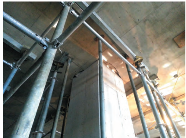
(b) 4층하부 모습