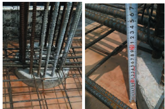
[그림 2] V/H분리타설에서 오류

일반적으로는 분리타설 위치를 슬래브하단 아래에서 하는 것이 원칙이나, 이러한 경우 기둥거푸집과 슬래브거푸집을 연결하여 조립이 어렵기 때문에 기둥을 슬래브 상부 면으로 올라가오게 한 뒤에 슬래브 거푸집을 기둥면에 대는 형태로 시공을 하였다. 이로 인해 그림2와 같이 슬래브 하부 면에서 기둥이 거의 5~10cm나 올라온 상태로 먼저 설치되어 뚫림전단시 적용되는 슬래브의 유효높이를 크게 줄이는 결과를 낳게 되었다.