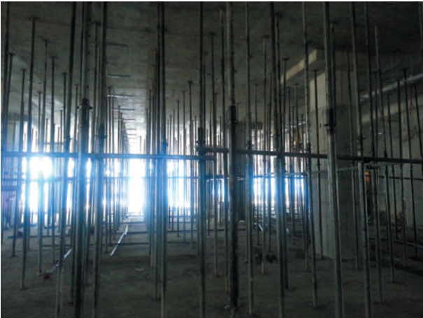
[그림 6] 3층에 재설치한 동바리 모습

그림 5에서 콘크리트 타설 직후 양생이 되기 전에 변형이 발생된 것을 알 수 있다.