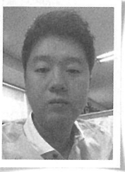
이 동 일 축산신문 기자

육우산업의 문제점을 들여다보기 위해서는 육우가 무엇인지를 파악하는 것이 먼저가 되어 할 것이다. 육우는 쉽게 보면 고기소다. 肉자에 牛자를 합한 것이니 고기소로 풀이될 수 있다. 그렇다면 광범위하게 보면 고기를 생산하는 소 전부가 육우가 될 수 있다. 여기서 이야기 하는 육우는 조금 다른 개념이다.