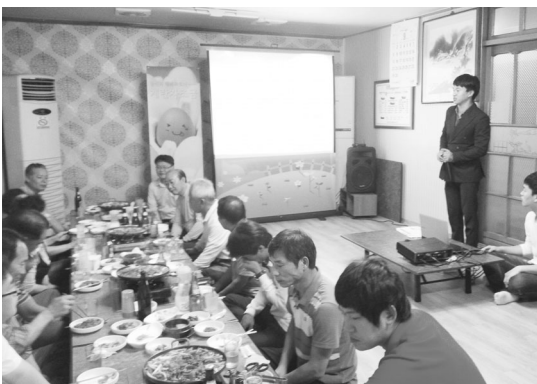
▲ 지역별 자조금 거출 간담회