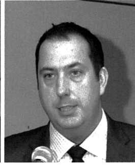
컬러인크젯 시장동향을 설명하는 스피드 포스트 그래픽커뮤니케이션 팀장