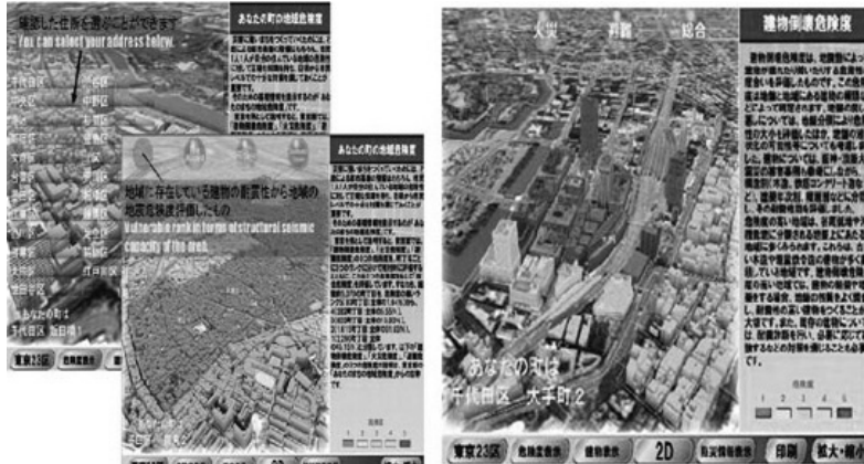
그림 3 방재 정보 공유 및 지진 방재 정보시스템

이는 지진의 발생 직후 피해의 범위를 확인하기 위해 만들어지면서 지진이나 재난발생 직후 기상청으로부터 보내지는 정보와 사전 데이터베이스에 등록된 데이터, 건축물의 파괴 수 등을 파악하여 자동적으로 작동하는 시스템이다. 지진 발생 10분 안으로 상황파악이 가능하여 조속한 대응을 취할 수 있다 18) . 또한 일본은 피해 조기파악 시스템을 구축하고 있어 피해 정보를 조기에 파악하여 신속한 대비 및 대피를 할 수 있다. 이는 인공위성을 활용하여 교통, 통신망이 두절되어도 재해 상황 등이 파악되어 이에 대한 대비 및 복구 활동을 할 수 있게 해놓은 시스템이다.