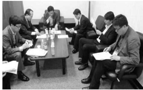
협회 주요현안 보고