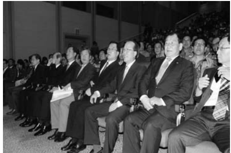
방재의 날 기념식 전경