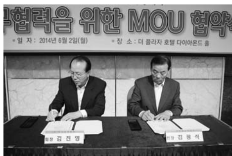
인천상공회의소 - 한국방재협회 업무협약식