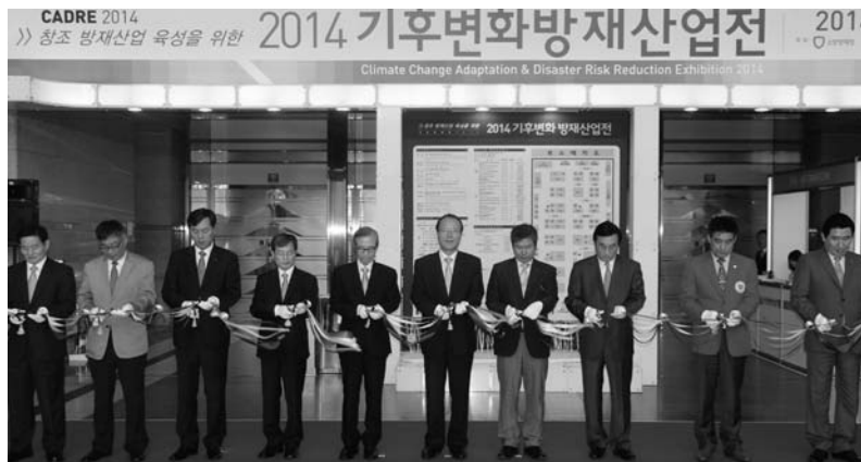
개막식 테이프 커팅

본 산업전과 동시개최 행사로 컨퍼런스(21개 세션)및 재난체험이벤트, 국제자연재해사진전등이 진행되었다.