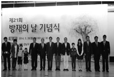
제21회 방재의날 기념식 수상자단체사진