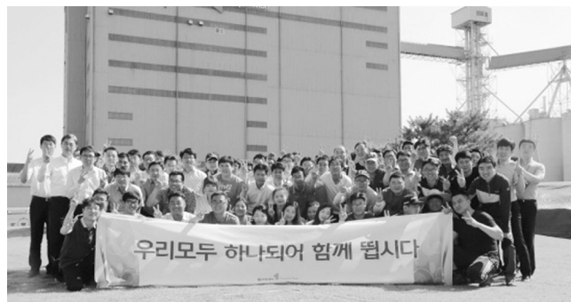
▲ 동아사료 사업전진 대회