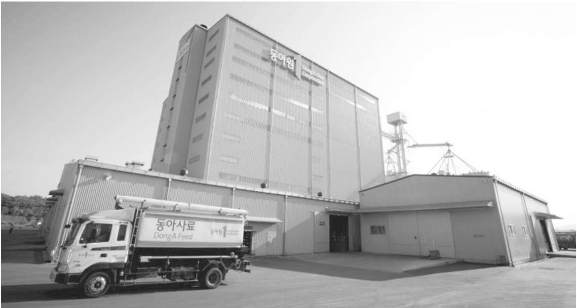
▲ 동아사료 당진공장 전경