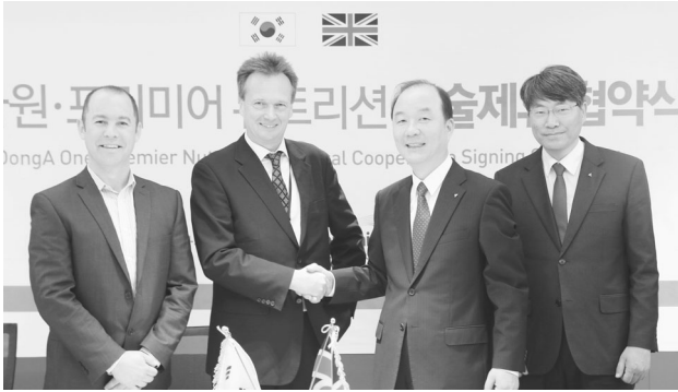
▲ Premier Nutrition과 기술제휴 재협약식