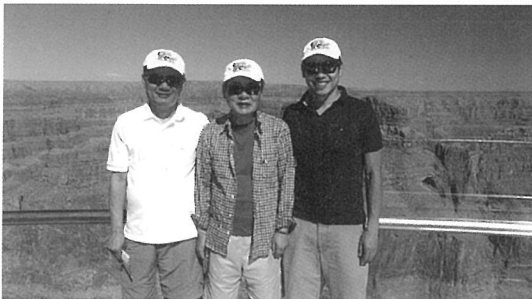
▲ 그랜드캐니언 웨스트림

이크가 설치되어 있었다. 총회 시작과 함께 소개 인사를 마친 후 전시장으로 발걸음을 돌렸다. 저녁 식사를 간단히 마친 후 라스베이거스에서 가장 유명하다는 벨라지오 호텔의 음악 분수를 공짜로 관람하였고, 후덥지근한 저녁 날씨임에도 음악분수가 나오는 그 순간만큼은 황홀경에 빠질 수 있는 아름다운 밤을 뒤로하고 호텔로 돌아왔다.