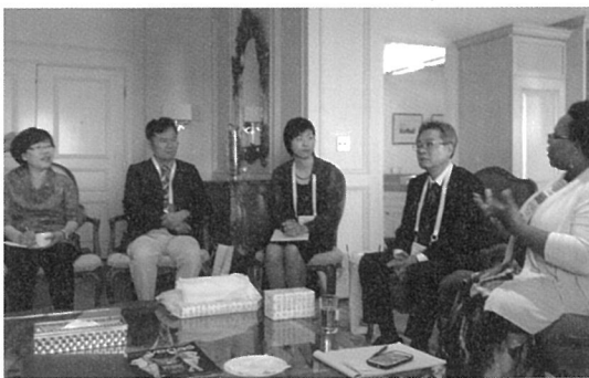
▲ ALA 신임 회장 접견