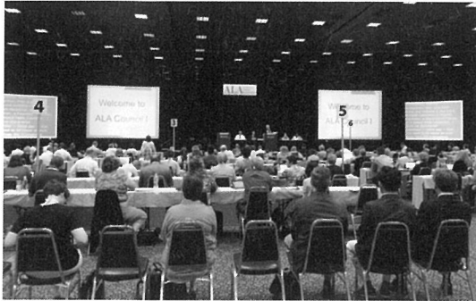
▲ ALA Council 총회 참석

지, 대부분의 세션과 프로그램에서 고품격의 다과 및 식사를 제공하는 것이 인상적이었다. 또한 유명 작가들의 사인회 및 출판기념회와 같은 형식의 프로그램이 다수 있었고, 출판사에서 주최하는 시상식 및 갈라쇼도 준비되어 있었다. 참가할 수 있는 시간적 여유와 프로그램 진행 내용을 사전에 충분히 숙지하지 못하고 참여한 것이 못내 아쉬웠다.