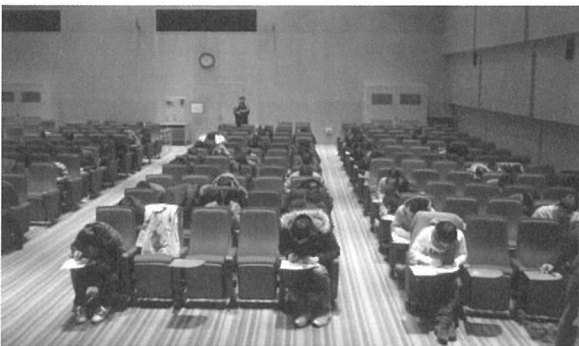
2012년 CFEI 자격시험 응시사진

KFPA 부설 방재시험연구원에서 개설중인 미국화재폭발조사관자격 과정을 이수해야만 KFPA를 통하여 CFEI 시험을 응시할 수 있는데 시험문제는 NCB가 보유하고 있는 문제은행에서 무작위로 선출한 객관식 및 O, X 형태의 100 문항이 출제되며, 응시자에게 허용되는 시험시간은 최대 2 시간이다. NAFI가 승인한 국내 시험감독관(PROCTOR)의 감독 아래 시험이 실시되며, 시험문제는 NCB에서 보유하고 있는 문제은행 중 선출되므로 당연히 영어로 출제된다. 따라서, 화재폭발 관련 지식과 실무경험이 풍부한 응시자라도 어학 때문에 발목을 잡히는 경우도 있다. CFEI 시험에 합격하기 위해서는 75% 이상의 점수를 획득해야 하며 시험결과는 오직 Pass/Fail 여부만 알려주고 점수는 공개되지 않는다. 시험결과는 응시 후 약 6주 정도가 경과되면 시험결과가 메일로 통보되는데 시험에 합격하지 못한 응시자는 시험 종료 후 최소 6개월이 경과해야만 CFEI 시험에 재응시할 수 있다.