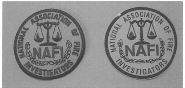
NAFI Patch 및 NAFI Emblem