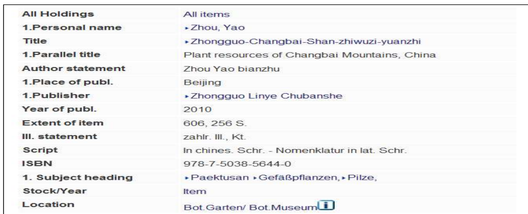
<그림 3> 베르린자유대학도서관의 목록레코드 예시

이와 같이 한국의 국경 및 영토와 관련된 대표적인 주제명인 '독도'와 '백두산' 등은 한국어 발음으로 표기되어 있지만, '압록강'과 '두만강'은 중국어 발음으로 되어 있다. '동해'는 일본의 입장에서 표기되어 있다.