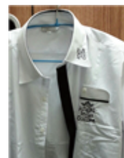
[Figure 9] Angel-in-us shirt