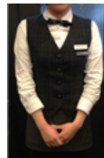
[Figure 18] Twosome place vest