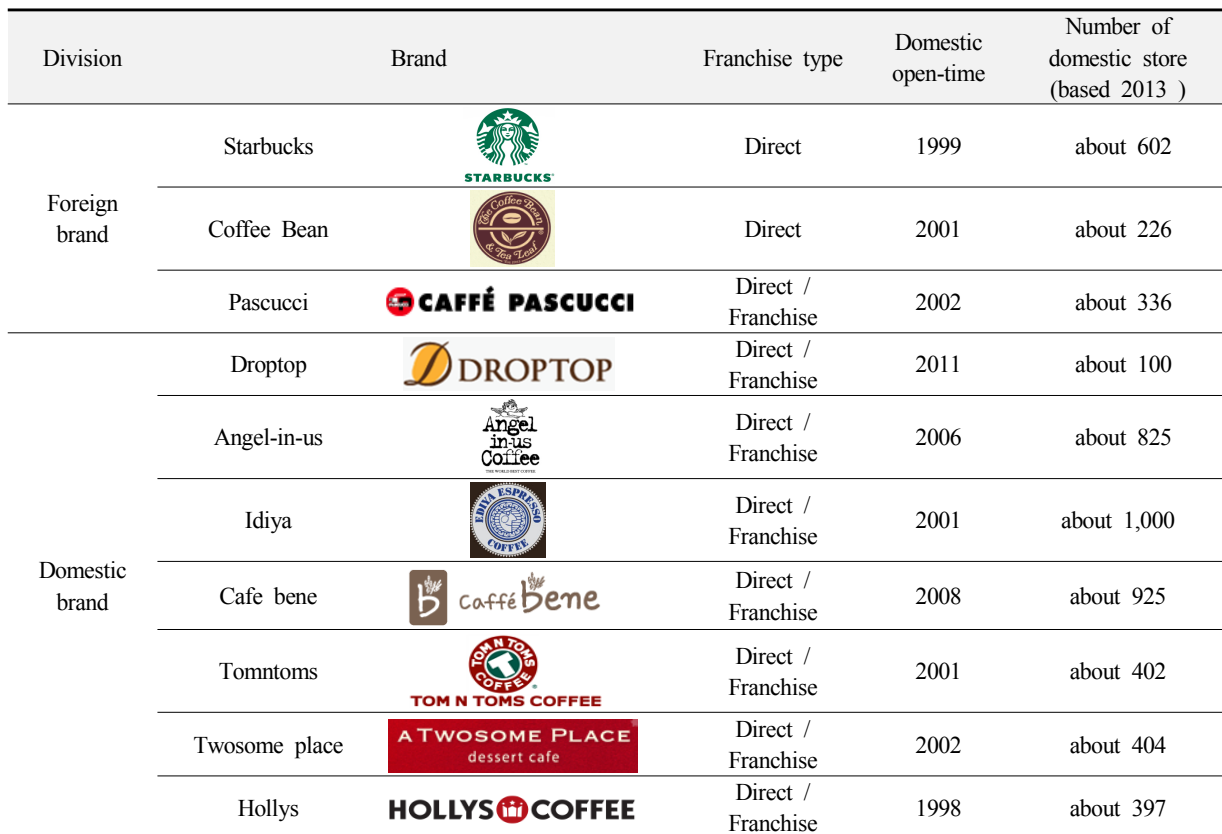
(Table 1) Targeted coffee houses

Note the coffee shop brand web site( http://www.istarbucks.co.kr/ , http://www.coffeebeankorea.com/ , http://www.caffe-pascucci.co.kr/ , http://www.cafedroptop.com/ , http://www.angelinus.co.kr/ , http://www.ediya.com/ediyaindex.asp , http://www.caffebene.co.kr/ , http://www.tomntoms.com/ , http://www.twosome.co.kr/main.asp , http://www.hollys.co.kr/ )