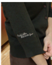
[Figure 20] Hollys cardigan

가디건은 겨울철에만 착용되는 아이템으로 성별이나 직급에 구분 없이 착용되었다. 6개 브랜드가 유니폼으로 구성하고 있었으며, 유니폼으로 지급되지 않는 4개사는