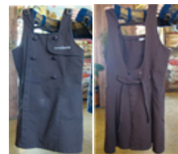
[Figure 15] Cafe bene apron