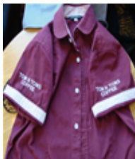
[Figure 16] Tomntoms shirt

투썸 플레이스는 누구나 와서 쉴 수 있는 만남의 장소를 의미하며 프리미엄 디저트 카페라는 콘셉트로 차별화