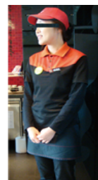
[Figure 5] Pascucci uniform