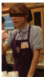
[Figure 2] Coffee Bean shirt