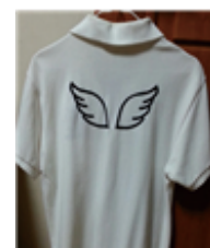
[Figure 10] Angel-in-us piquet shirt