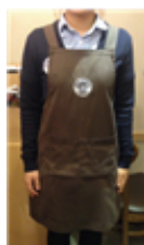
[Figure 12] Idiya apron