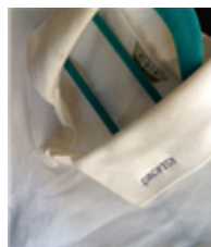
[Figure 7] Droptop piquet shirt