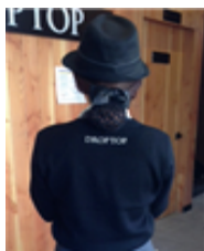
[Figure 6] Droptop cardigan

엔제리너스는 2000년 롯데리아의 '자바 커피'를 모태로 시작되어 2006년 브랜드 네임을 변경하였으며, 우리안의 천사라는 의미의 차별화된 네임으로 여성스럽고 따뜻한 이미지를 나타낸다. 특히 일러스트 작가 이우일과의 협업으로 탄생한 세 천사 가브리엘, 라파엘, 안젤라 캐릭터는("Angelinus", 2014) 브랜드를 상징하는 시각적 요소이자 유니폼, 컵, 가구, 출입문 손잡이 등 다양한 요소에