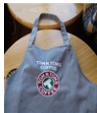
[Figure 17] Tomntoms apron, hunting cap