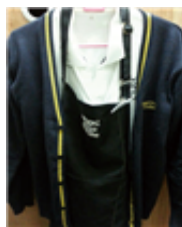
[Figure 8] Angel-in-us cardigan