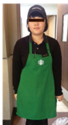
[Figure 1] Starbucks uniform