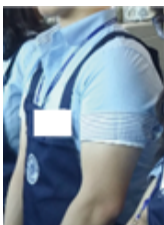
[Figure 11] Idiya shirt