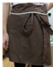
[Figure 22] Hollys apron