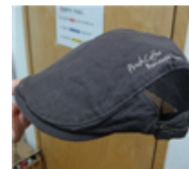
[Figure 23] Hollys cardigan