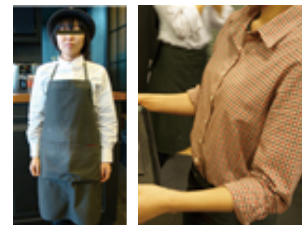
[Figure 19] Twosome place shirt, apron