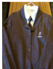
[Figure 13] Cafe bene cardigan