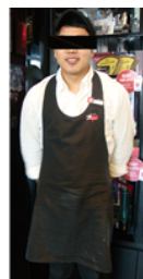
[Figure 4] Pascucci uniform