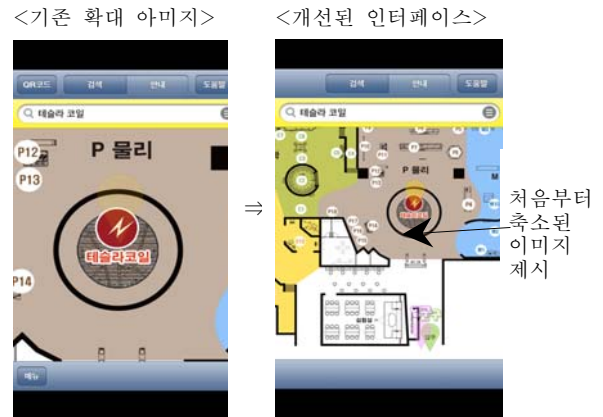
<그림 4> 축소된 지도 이미지로 제시

확대된 이미지를 제시하여 학습자가 전시물을 보기 위한 객체를 바로 확대·축소하는데 어려움이 있었다. 처음부터 축소된 지도 이미지를 제시하여 학습자가 전시물의 위치를 찾는 행동을 할 수 있게 수정하였다.