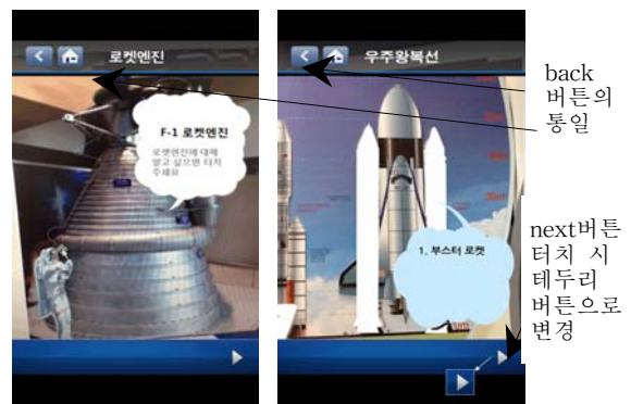
<그림 7> 일관된 back버튼과 정확하게 터치할 수 있는 next버튼

있었다. back 버튼을 하나의 버튼으로 수정하여 모든 페이지에 back 버튼의 모양을 일관성 있게 배치하였다. 또한 6가지 전시물 중에서 3가지 전시물은 자세한 사항을 보거나 들을 때는 깜박거리는 말풍선을 터치를 해야 하지만, 나머지 다른 3가지 전시물은 말풍선이 아닌 next 버튼(▶)을 눌러야 설명을 듣거나 볼 수 있어 학습자들에게 혼동을 주었다. 따라서 모두 깜박거리는 말풍선을 터치를 터치할 수 있게 인터페이스를 제시하였다.