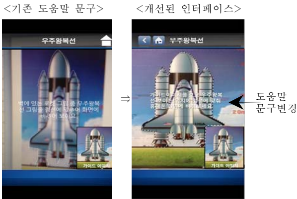
<그림 5> 안내 문구 수정

넷째, 학습자가 전시물에 대한 학습하는 데 모르는 용어가 나왔을 때, 그것에 대해 찾아보고 볼 수 있게 용어사전을 추가하였다. ‘부스터’와 같은 학습자가 이해하기에 어려운 용어가 나올 경우 <그림 6>과 같이 링크(밑줄을 그어 링크라는 것을 표시)를 연결하여 해당 용어를 터치하면 바로 용어사전과 그 용어와 관련 이미지와 동영상상을 제시하여 학습자들이 보다 이해하기 쉽게 하였다.