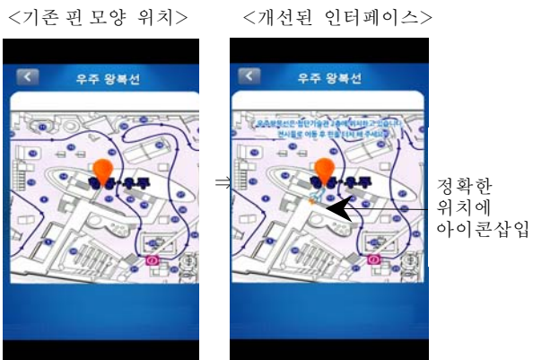
<그림 3> 정확한 위치에 아이콘과 문구수정

첫째, 모바일 시스템에 사용된 아이콘의 잘못된 정보를 수정하였다. 박물관 시스템의 지도에서 엉뚱한 곳을 터치하지 않기 위해서 정확한 위치를 터치할 수 있도록 로켓엔진 아이콘을 삽입하였고 핀을 터치 안하는 학습자를 위해서는 로켓엔진 아이콘도 같이 터치 가능하게 하였다.