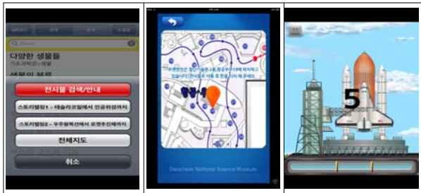
<그림 2> 박물관 교육 모바일 애플리케이션 화면

이션을 사용하였다. 이 교육 시스템은 전시물 검색 안내, 전체지도 안내, QR 코드인식과 전시물 인식을 통한 전시물 설명과 체험하기 등의 기능을 가지고 있다. 박물관 교육 모바일 애플리케이션의 화면은 <그림 2>와 같다.