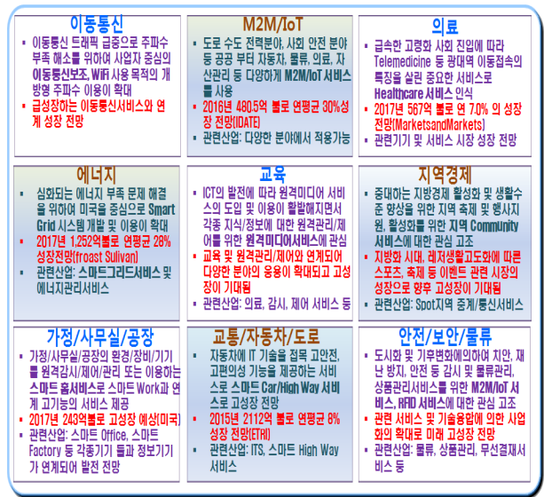
그림 2. 창의적 전파서비스의 이용동향 [12] Fig. 2. Status of using creative wireless services [12] .