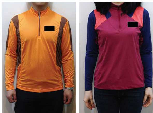
Figure 1. Figures of test garments(left: male, right: female).

FT-IR spectrometer를 이용하여 37°C, 파장 5~20μm의 범위에서 가공 전과 가공 후 소재의 원적외선 방사 특성을 측정하였고, 세탁회수에 따른 비교를 위하여 세탁 전과 20회 세탁 후, 50회 세탁 후의 원적외선 방사특성을 측정하였다.