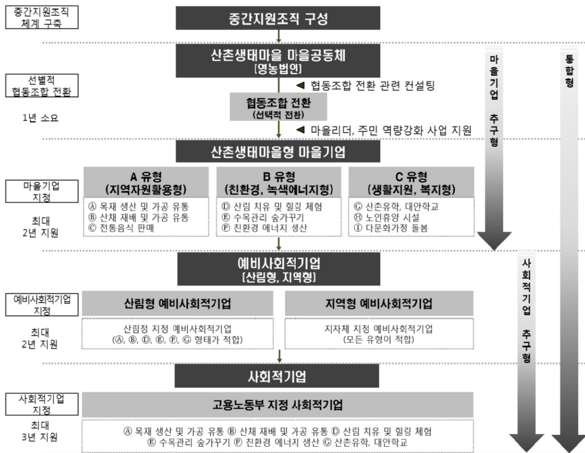
Figure 2. Stage-by-Stage Detailed Execution Direction for Social Economic Promotion of Mountain-Eco Village

셋째, 3단계(성장단계)는 마을기업 지정의 단계로 선별적으로 전환된 협동조합 또는 영농법인의 특성에 따라 지역자원활용형, 친환경·녹색에너지형, 생활지원·복지형 등 3개 유형으로 구분하고 세부 사업아이템 육성을 지원한다. 이를 위해서는 중간지원조직을 통한 교육 및 외부전문가그룹에 의한 컨설팅 계획이 수립되어야 한다. 또한 마을기업 선정시 필요한 요건 및 지정 시기 등을 파악하여 지정을 위한 평가시에 불이익이 최소화 될 수 있도록 지자체 및 광역지자체와의 협조 체계가 구축되어야 할 것이다. 이후 마을기업 재평가에 대응한 지속적인 성