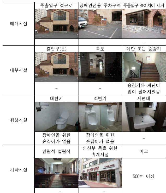
<표 9> 봉산동성당의 장애인 편의시설 설치현황

화장실에서 장애인을 배려하는 시설이 없었다는 점을 제외하고는 전반적으로 아래 표에서와 같이 시설기준을 잘 충족하고 있었다. 특히 가로변에 면한 성당 부설 카페가 인상적이었는데, 인근 주민들 및 신자들의 지역 중심체로서의 사랑방 역할을 하고 있음을 알 수 있었다.