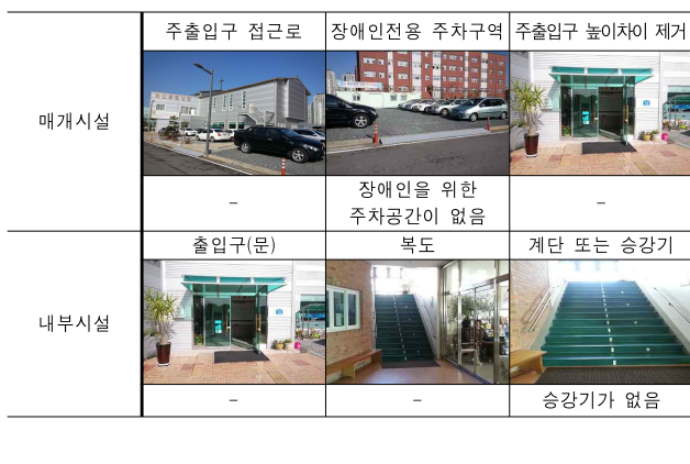
<표 14> 원신흥동성당의 장애인 편의시설 설치현황

도안신도시 진잠천변의 좋은 입지에 있으면서도 장애인을 위한 별도의 주차공간은 없었고, 주출입구에 작은 경사로가 있었지만 준공 후 발생한 단차를 해결하기 위해 덧댄 철판 형식이었고 경사로와 출입문 사이공간이 1m 남짓으로 협소하여 휠체어를 탄 장애인의 회전반경이 미확보됨을 알 수 있었다. 또한 화장실에도 장애인을 배려한 시설은 전무했다. 물론 향후 제대로 된 신축을 예정하고 있는 점을 감안하더라도 무엇보다도 가장 심각한 문제는 본당이 2층에 있음에도 불구하고 승강기가 없어 사실상 장애인의 미사 참여가 불가능한 상태였다. 12)