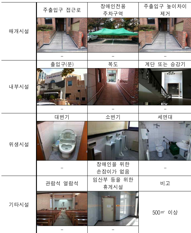
<표 7> 전민동성당의 장애인 편의시설 설치현황

1998년 이전 준공된 성당 중에서 가장 장애인 편의시설이 모범적으로 구비된 성당이였다. 화장실 소변기에 지지할 수 있는 스틸 손잡이가 없는 것만 제외하고는 무엇 하나 나무랄 데 없이 잘 갖추어져 있었다.