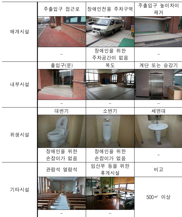
<표 13> 하기동성당의 장애인 편의시설 설치현황