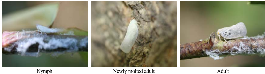
Fig. 1. Life cycle of Metcalfa pruinosa .

납 물질을 분비하여 붙어 있고, 탈피각은 대부분 앞의 뒷면에 부착시킨다. 성충은 주로 7월 중순에서 10월 말까지 출현한다.