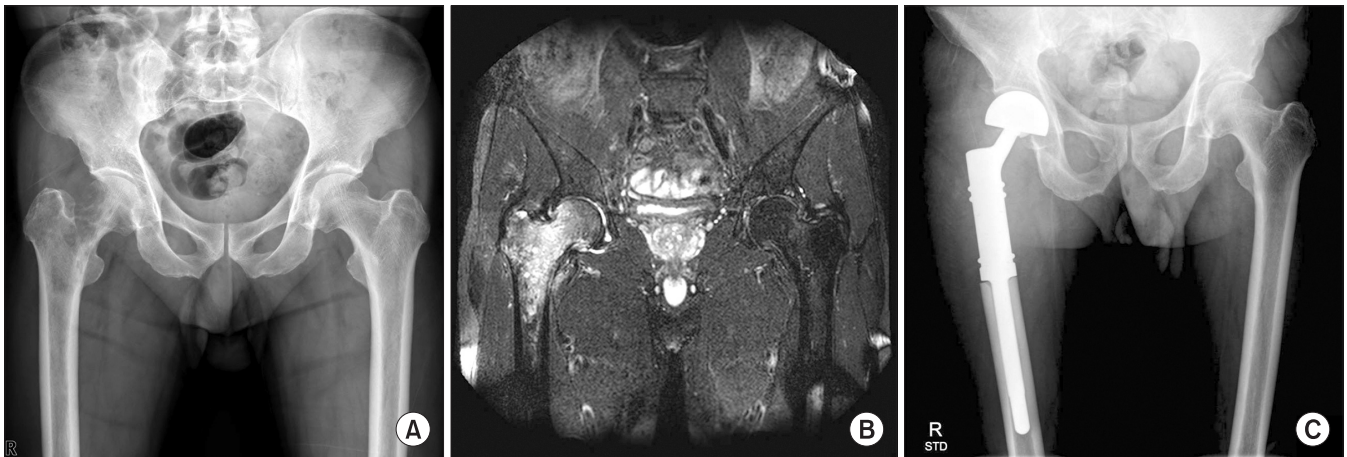
Figure 1. 58-year-old man with metastatic cancer (A) Pre-operative radiograph of right proximal femur shows irregular osteolytic lesion. (B) Coronal T2WI MRI of right proximal femur reveals high signal intensity with heterogeneous enhancement. (C) Wide resection and reconstruction with tumor prosthesis (MUTARS ® ) was performed.

*F, female; M, male; HCC, hepatocellular carcinoma; RCC, renal cell carcinoma; MPNST, malignant spindle cell tumor; MM, multiple myeloma; AWD, alive with disease; CDF, continuous disease free; DOD, dead of disease; NA, not available.