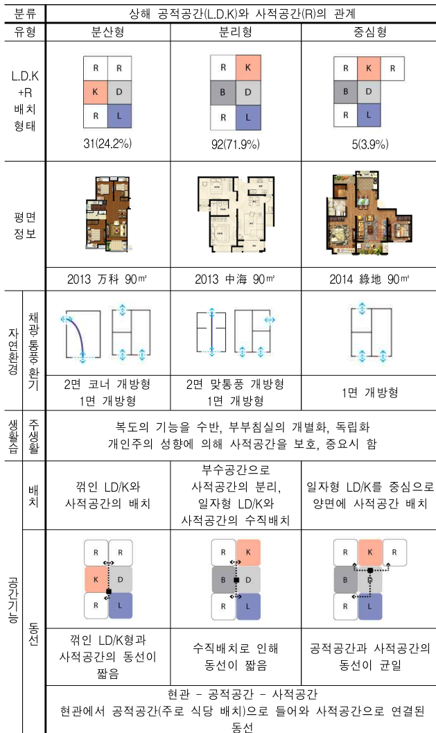
<표 8> 상해 공적공간(L,D,K)와 사적공간(R)의 관계

상해의 경우 분리형이 92개 71.9%로 가장 많이 나타났다. 일자형의 공적공간으로 자연환경측면에서 2면 맞통풍 개방형과 사적공간은 1면 개방형으로 이루어져 있다. 공간기능 측면에서 일자형과 사적공간의 수직배치로 공간간의 동선이 짧다. 그리고 개인주의 성향에 의해 사적공간을 중요시 여겨 현관에서 공적공간으로 들어온 뒤 사적공간과 연결되는 평면구성이다. 분석 내용은 아래 <표 8>와 같다.