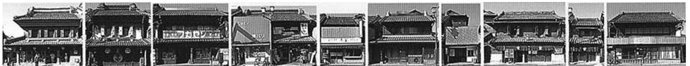
Fig. 4. Kurazukuri Buildings at Ichibangai, Kawagoe (Upper Image) (A-A' Facade Cuts from Fig.3)

카와고에(川越市)시에서 쿠라츠클리(藏造り)는 건축사적인 측면에서 문화재의 가치와 더불어 개별건축물의 독자성이 돋보이는 복합적인 현상으로, 지역의 보수적인 커뮤니티를 지속시키는 유효한 기능도 하고 있는 것으로 파악되었다. 건축문화재 개념의 확장과 새로운 가치의 부여 그리고 이를 향유하고 확산시키는 전략은 문화적 소비창출이라는 방식으로 역사적 도시환경의 보존과 도심재생의 두 가지 목적을 달성할 수 있도록 한다.