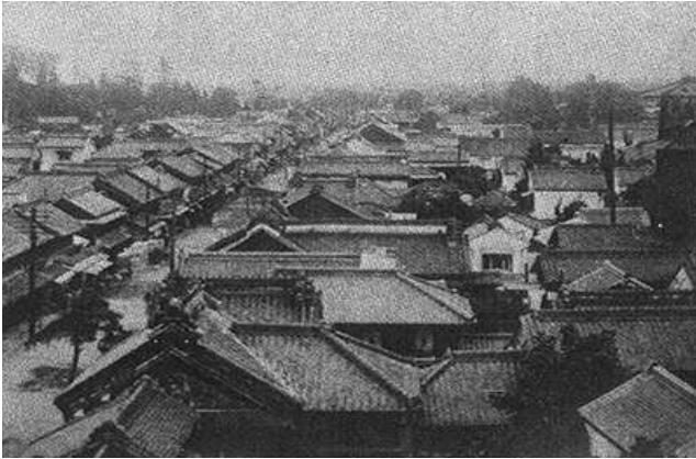
Fig. 2. Townscape of Ichibangai, City of Kawagoe, Japan (1920s)

건축이 건축된 시기는 에도시대로 1893년 화재 이후 재건했을 때 보다 시간을 더 거슬러 올라가므로 전선의 지중화까지 이루어진 것이다. 전신주가 철거된 덕분에 카와고에마츠리(川越祭) 축제는 전통 건축물로 가득찬 가로를 배경으로 전근대적인 분위기가 물씬 풍겨난다. 14) 건축물의 보존과 구도심의 활성화라는 목적을 달성하기 위한 여러 가지 추가적인 노력도 경주되었다. 관광객을 겨냥한 1920년대의 시내버스까지 도입하여 운항하도록 하는 지혜는 다른 일본의 지방도시에도 파급되어 좋은 반응을 거두고 있다. 15)