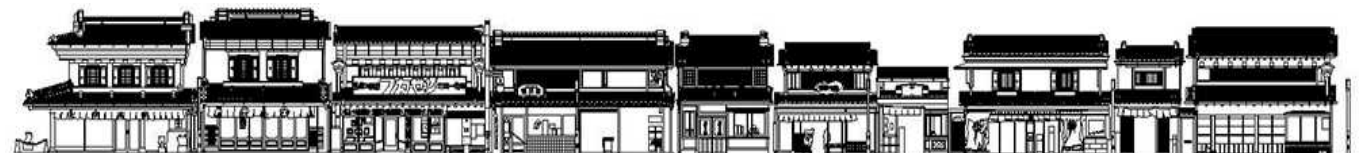
Fig. 5. Kurazukuri Elevation at Ichibangai, Kawagoe (Lower Image) (A-A' Facade Drawing from Fig.3)