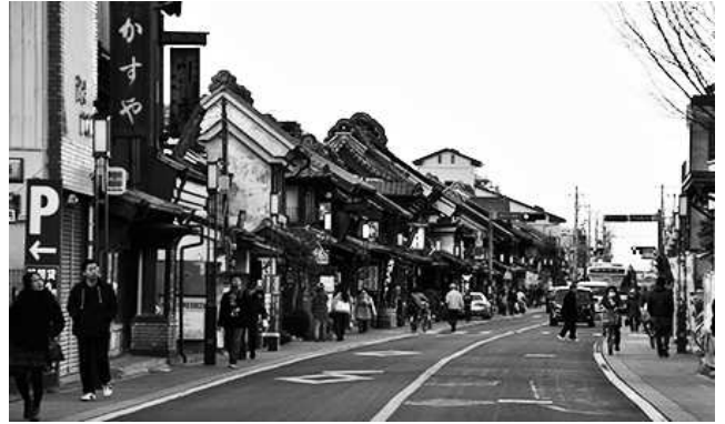
Fig. 1. Townscape of Ichibangai, City of Kawagoe, Japan (2012)

이치반가이(一番街)는 1893년 대화재이후 방화구조를 가지게 되었고 창고업을 주축으로 한 지역의 특성덕분에 건축양식의 일관성과 연속성이 확보되어 보존대상으로서의 문화적 가치가 뚜렷이