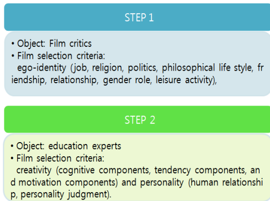
[Fig. 1] Film selection step

성 전문가 3인은 2013년 1월부터 3월까지 죽은 시인의 사회, 간장선생, 리틀부다, 텔마와 루이스, 샤이 등 다섯 편의 영화를 가지고 관찰자간 신뢰도를 산출하기 위해 관찰자 훈련을 실시하였다. 즉 제시된 다섯 편의 영화를 각자 보고 체크한 후 관찰자간 신뢰도를 구하였다. 세 사람의 의견 일치율이 이루어지지 않을 경우 함께 모여 의견을 조율하는 과정을 더해 관찰자간 신뢰도가 70% 이상 일치할 때까지 연습하였다.