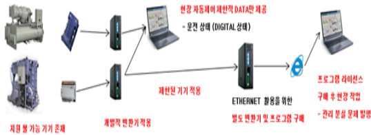
(그림 1) 기존 HVAC 시스템

어지지 않아 주기적으로 현장 점검을 해야 하는 비효율성과 비용 부담을 가져온다. 또한 개별적인 프로토콜을 변환기를 개발하고 제한된 기기에서만 적용되는 번거로움과 개별 사이트마다 공조 장치들을 관리하는 시스템으로 구성되어 프로그램 라이선스를 부담하여야 하며 관리 대상 항목도 극히 제한적이다.