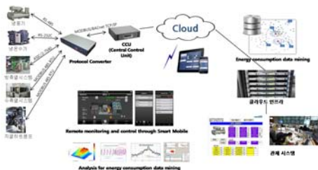
(그림 2) 개발 시스템 구성도

클라우드 환경에서 각 공조 장치들의 실시간 휘발성 데이터를 수집 할 수 있으며 향후 빅데이터 분석을 통하여 공조 장치 유지/보수 및 에너지 절감 등에 활용될 수 있다.