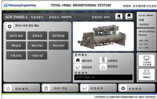
(그림 7) 공조장치 모니터링 화면

공조 제어 웹 서비스는 HTML5 로 개발되었으며 사용 편의성을 위하여 가독성 있는 GUI를 제공하였다.