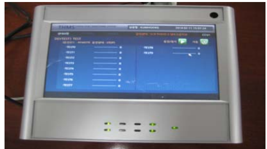
(그림 4) CCU 장치 동작화면