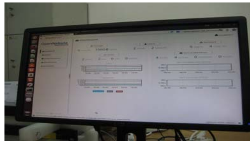
(그림 5) 클라우드 성능 테스트 장면

구축되었으며 대상 서버를 기반으로 customizing 작업이 수행되었다. 클라우드 시스템의 안정성 및 performance 확보를 위하여 2012년 10월부터 2013년 3월까지의 뉴스 데이터 24,000여개(약 57MB)를 대상으로 분산 처리 속도를 측정, 개선하였다.