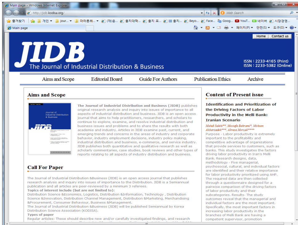
<Figure 2> Homepage of the Journal of Industrial Distribution & Business

다섯째 편집인 및 저자의 국제적 다양성과 방대한 양의 논문 출판의 기반을 마련하였다. 즉 편집위원과 투고자의 국적이 아시아, 미주 등 여러 대륙, 다양한 국가로 다원화되어 있다, 특히 각국의 석학이 동아시아 경제, 경영 이슈를 폭넓게 연구하고 토론할