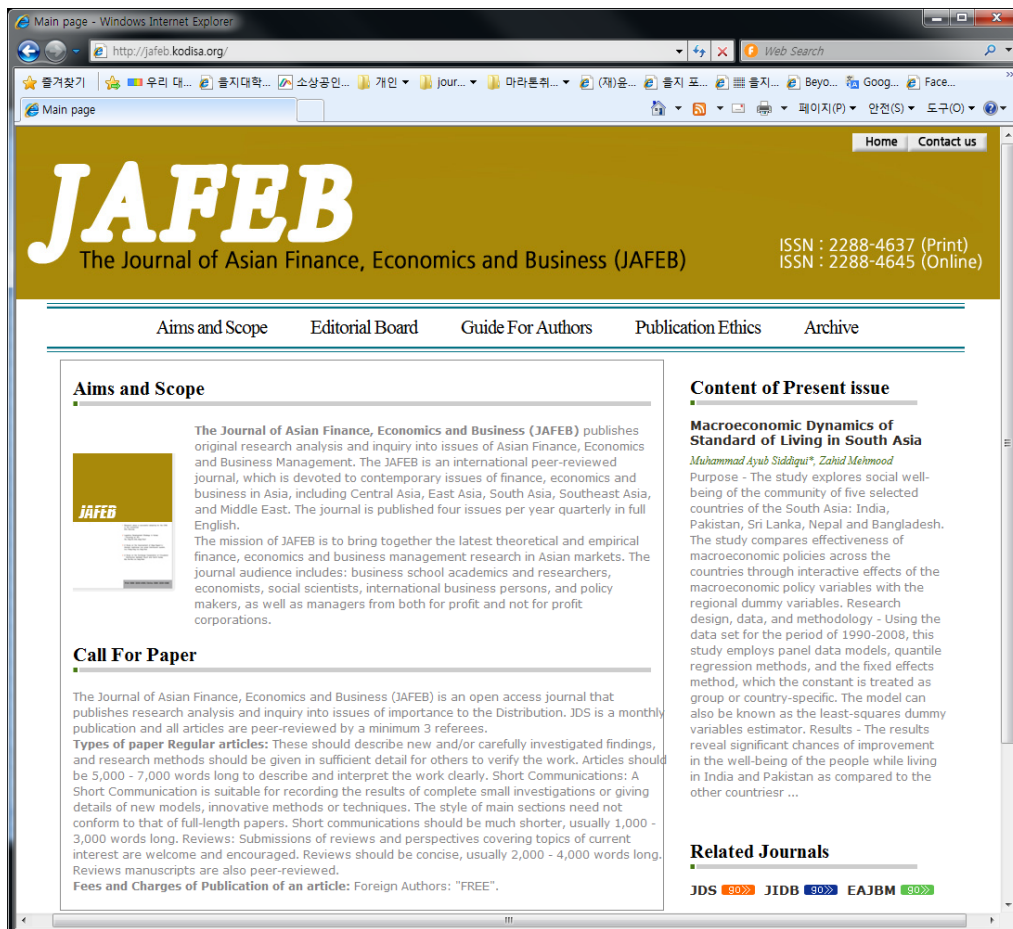
<Figure 4> Homepage of the Journal of Asian Finance, Economics and Business