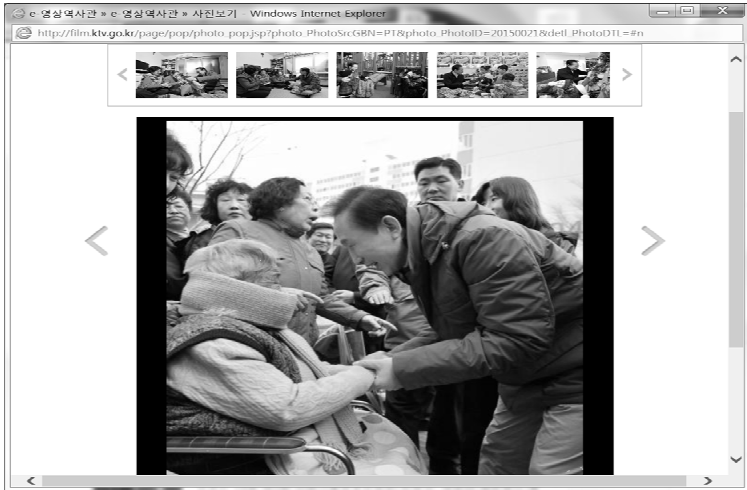
〈그림 4〉 e영상역사관 2009.12.24 국가기록사진 35)

이것은 대중을 향해 펼쳤던 정치적 마케팅의 결과물을 다시 ‘기록사진’이라는 대체 불가능한 증거를 대며 진정성이라는 기호로 기만하는 것이다. 사진과 기록영상의 본분은 원본을 재현하는 복제이미지였다. 그러나 선별과 배치, 기술에 따라 이미지를 생성하고 있다. 생성 이미지가 만들어내는 허구는 적어도 그 공간 내에서는 사실에서 비롯된 진실로 기능한다. 그래서 이미지로 텍스트를 쓴 역사는 일종의 신화가 되었다. 이러한 정치적 도구로서의 사진은 사진 기록의 객관성이란 어찌