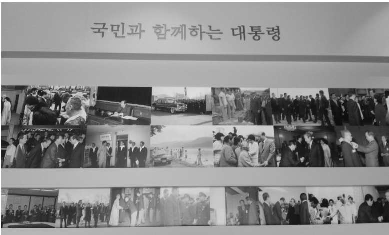
<그림 5> 성남 대통령기록관 ‘국민과 함께하는 대통령’ 전시 일부 36)

대통령이 참석하는 행사를 위해 오래 전에 동원된 국민들, 의례적으로 잠시 얼굴만 내비치고 바로 떠나간 대통령참석 국가 행사, 동원된 국민 앞에서 사진을 찍기 위해 일부러 멈춰 선 순간 포착, 기록으로 남