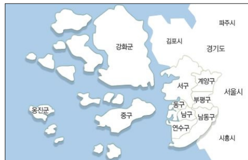
<그림 1> 인천광역시 행정구역

3개의 지역으로 구분하였지만 군집 분석에 사용된 변수에 따라 각 구와 군은 다른 군집에 속할 수 있다는 점과 명확하게 원도심, 신도심, 도농 복합도심으로 구분되기는 쉽지 않고 각 특성이 어느 정도 혼재되어 있는 것이 연구의 제한점이다. 이 제한점을 보완하기 위해 윤현위(2008)와 윤호(2012)의 연구를 기반으로 하여 인천시 제도공간의 변화와 <그림 1>과 같이 8개구 2개 군으로 이루어진 인천광역시의 인구, 주거, 문화 기반 시설, 공공도서관 현황으로 분류하여 그 지역의 특성을 살펴보고자 한다.