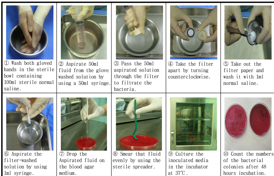
Figure 1. Specimens taken and cultured.

수술 시에 착용한 장갑에서 세균을 채취하고 배양하는 방법이나 절차상의 문제점을 사전에 검토하고 연구대상의 효과크기를 구하기 위해 2011년 4월 18일부터 6월 5일까지 한 그룹당 5건씩, 총 15건의 대장암수술을 대상으로 예비실험을 진행하였다. 예비실험 결과, 세균채취나 배양 등 측정 상의 문제점을 비롯하여 장갑교환 시의 특별한 어려움이 발생하지 않아 본실험을 진행하였으며, 예비실험에서 수집한 자료는 최종결과분석에는 사용하지 않았다. 한편, 본 연구에서는 무작위대조군 사후 설계를 사용하였기 때문에 사전 조사를 실시하지