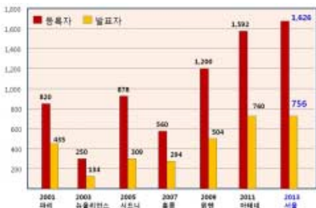
Fig. 1. Number of participants and presentations(oral and poster) in each IAPD congress.

초청 연자와 좌장을 지역별로 배분하여 각 대륙별, 나라별 관심을 유도하였다(Fig. 2). 한국을 처음 방문하는 외국인들에게 낯선 한국에 대한 거리감을 없애기 위해 한국의 관광 자원들을 이용한 다양한 이미지로 사전에 35차례의 전자메일(e-blast)을 꾸준히 발송하였다. 페이스북을 통해서서는 한국의 일상적인 모습들을 담아 참가자들에게 자연스럽게 친근감을 높였다. 무엇보다도 역대 IAPD 대회에서는 시도하지 않았던 ‘개발도상국가 참가자 등록비 할인 정책’을 통해 대회 참가의 장벽을 많이 낮추었다. 특히 카자흐스탄, 캄보디아와 같은 개발도상국가의 참가자들이 100명 이상 서울 대회에 참여하면서 IAPD 세계 무대에서 진정한 의미의 참여와 협력의 장을 마련하였다.