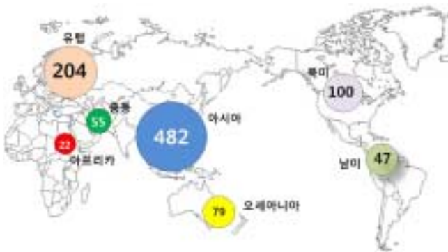
Fig. 3. Distribution of the participants according to the continent.