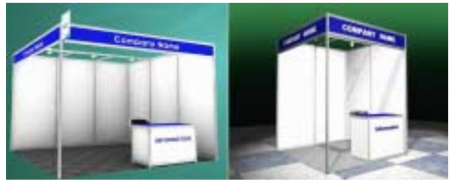
Fig. 4. Types of booth. Standard booth(left) and mini booth(right).

1,000여명이 넘는 해외 참가자들을 고려하여, 전시장 내 한국 문화를 소개하고 체험할 수 있는 다양한 이벤트 부스 구성